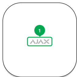
1 - Logo Ajax avec indicateur de lumière